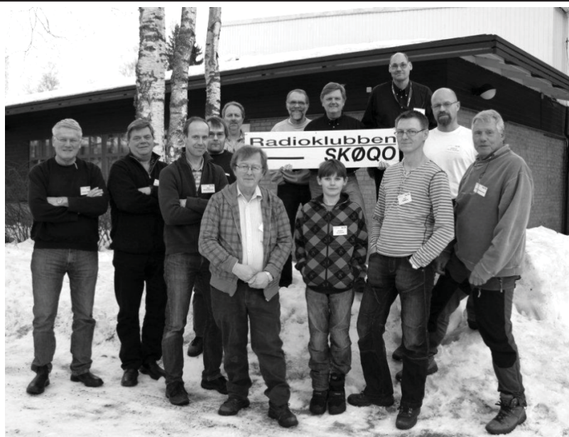
Första kursgänget inkl fyra av lärarna.