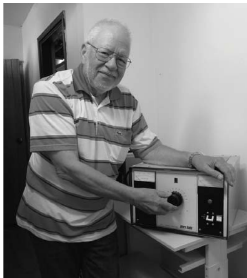
Henry 2KD-5. Klubbens nya slutsteg.

Han har också sysslat med piratradio, han var chefs-tekniker på Radio Nord i Östersjön och har också arbetat på Radio Caroline. Detta var på det glada 60-talet.