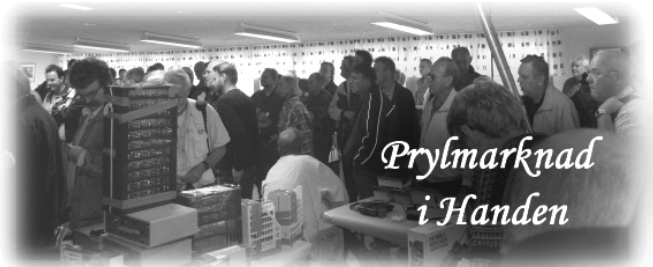
Prylmarknad i Handen