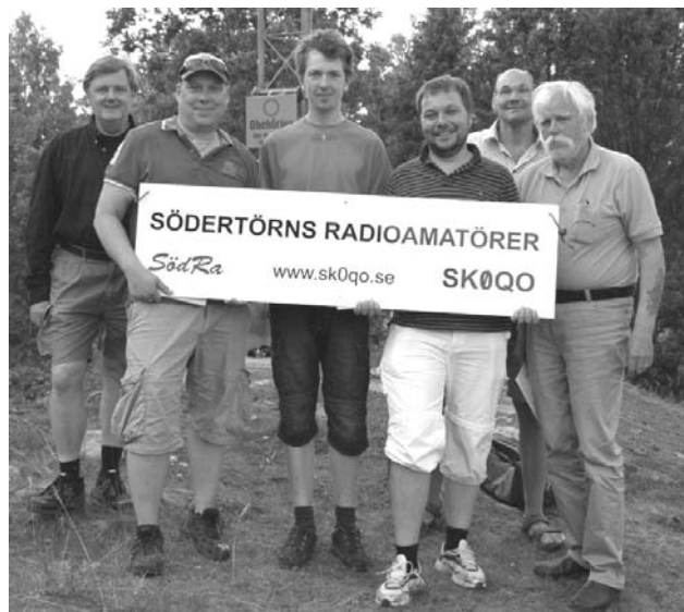
Ett glatt gäng. Sommarkursens deltagare inkl två av lärarna.