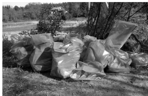
Ett sopberg blev det till slut!