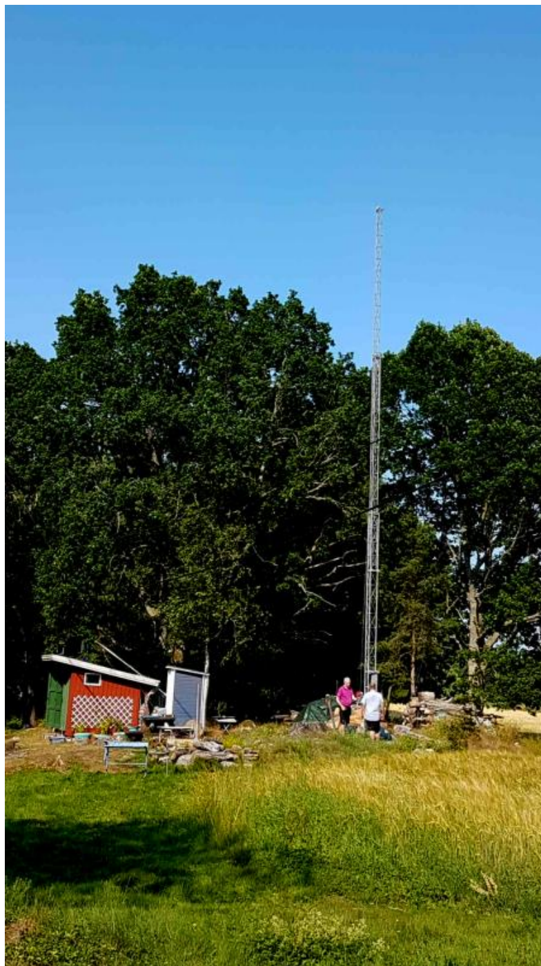
Versatower nr 2 i full höjd. Återstår montering av antenner för 2 m och 70 cm och eleveringsrotor.