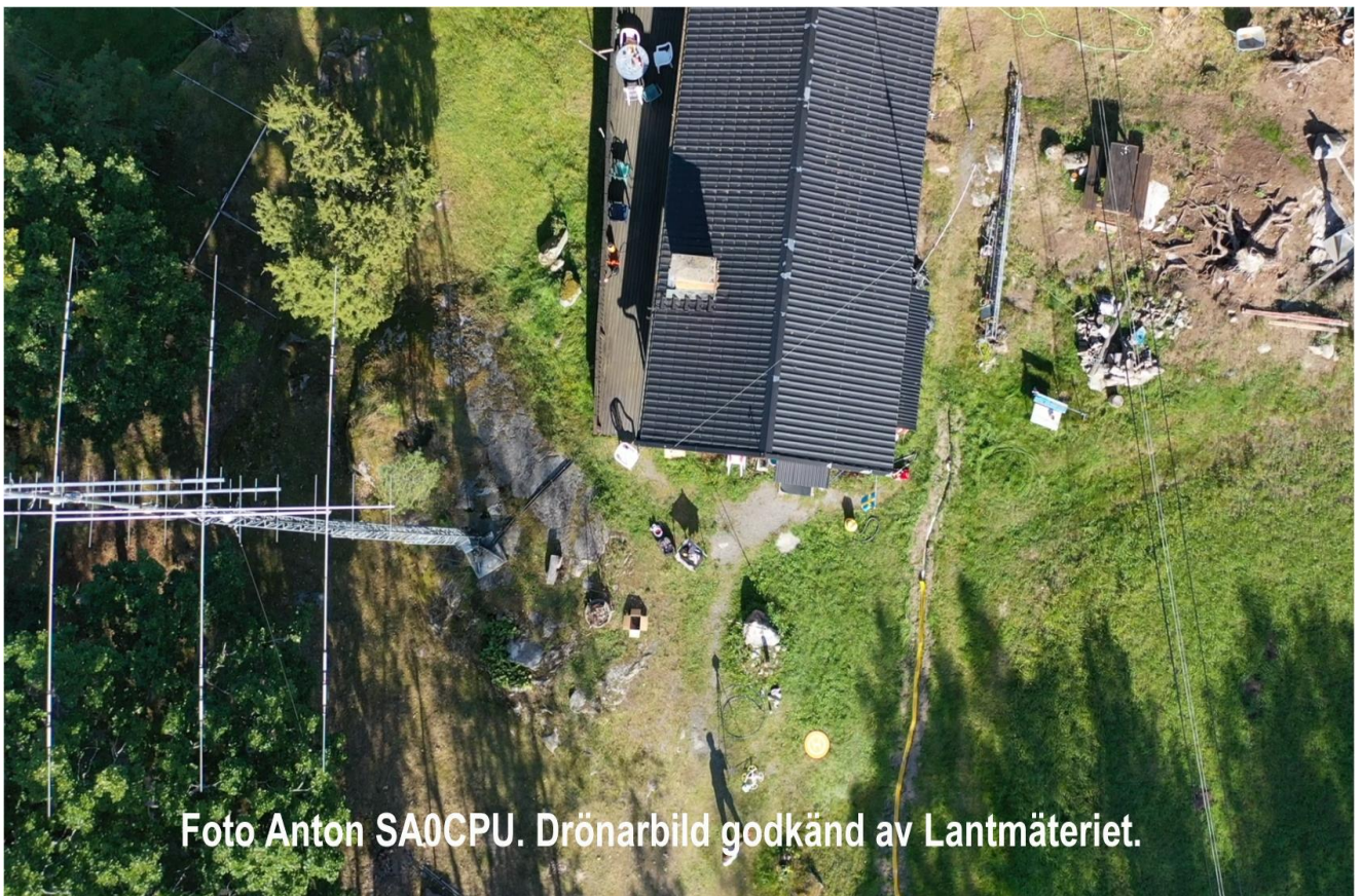
Drönbild godkänd av Lantmäteriet.